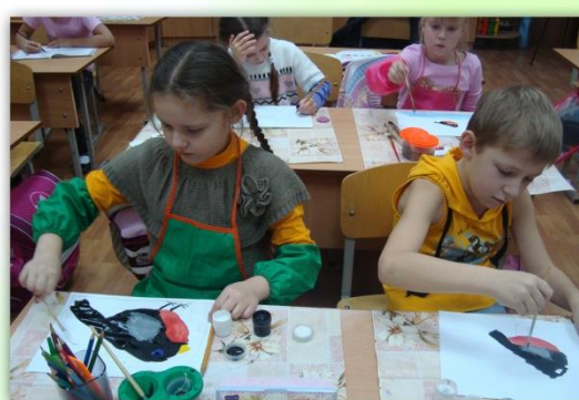
Экологический тренинг «Спаси птенца»