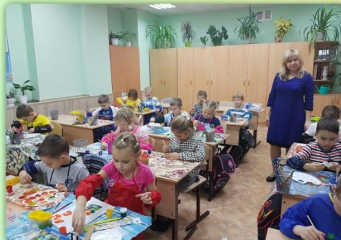
Изготовление лэпбука «Осень»