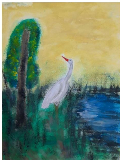
Экологическая акция «День журавля»