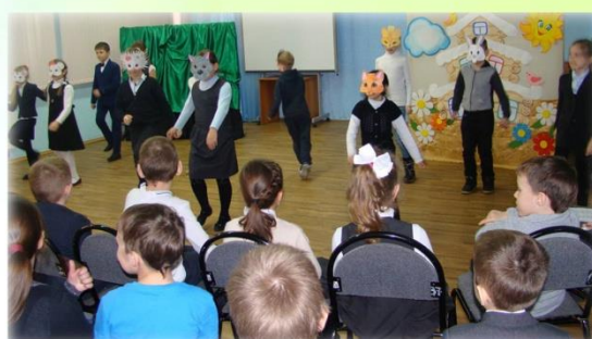
Театрализованная игра «Экотеремок»