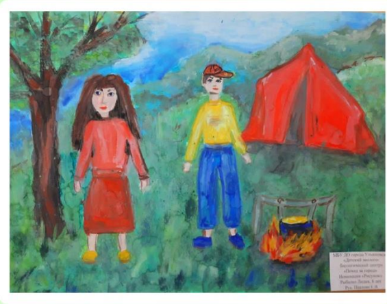
«Экскурсия в природу»