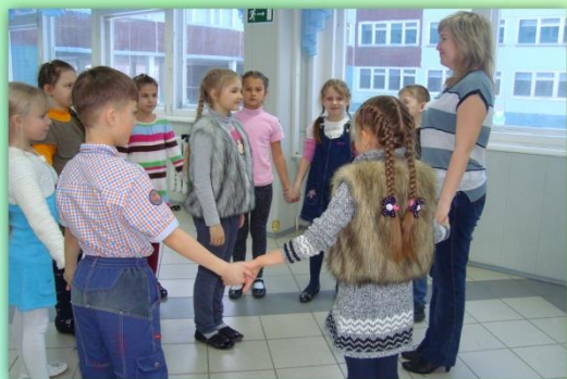
Арт-терапевтическое упражнение «Природа в моей жизни»