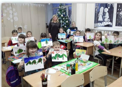
Экологическая сказка «История одной ели»